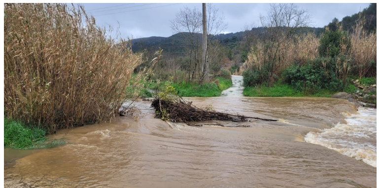
La Boyne le 9 mars 2025

En ce qui concerne la pluviométrie, la commune de Cabrières est classée dans la zone des Hauts Coteaux.